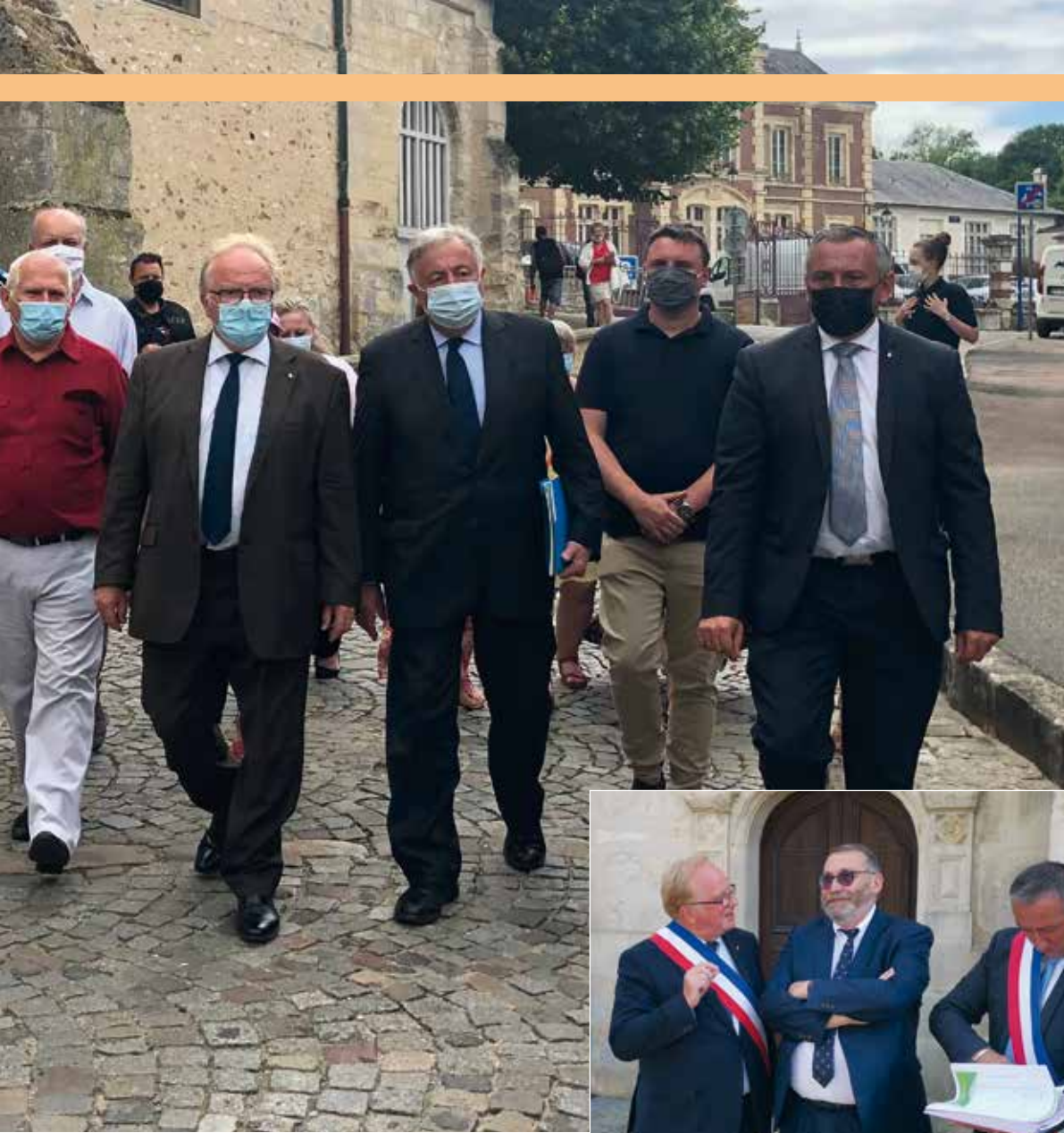
Le 18 juin dernier, Gérard Larcher, Président du Sénat, est venu découvrir les grandes orientations du projet de réhabilitation du centre-ville d'Épône.