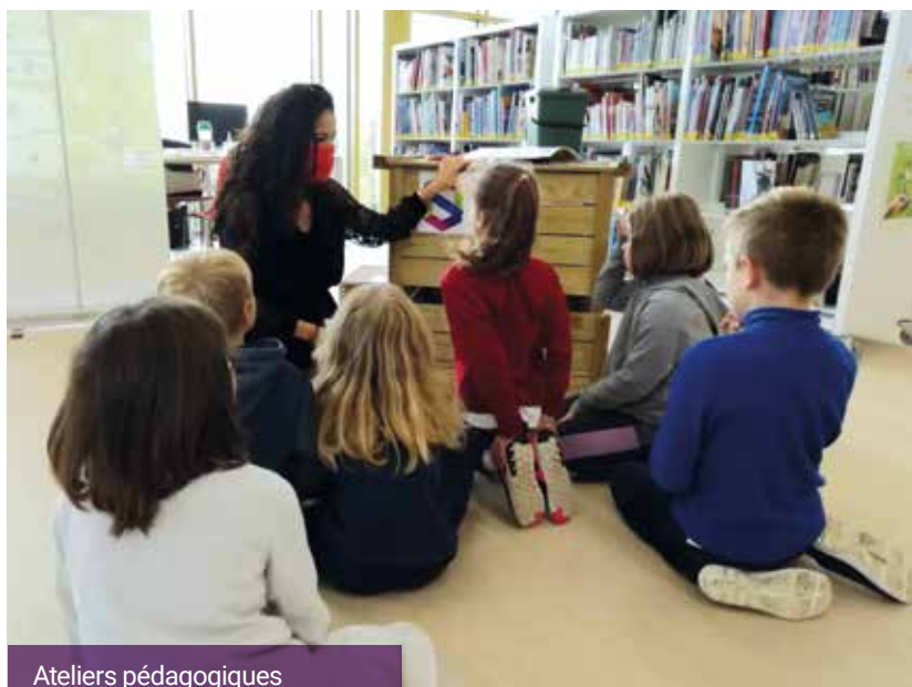
Ateliers pédagogiques sur la biodiversité avec GPSEO

La semaine de l'environnement s'est tenue du 3 au 10 octobre à la médiathèque Pierre Amouroux. 538 élèves des écoles de Pasteur et Madeleine Vernet ont participé aux ateliers pédagogiques autour de la préservation de notre planète, de la biodiversité, du tri des déchets, 3 conférences grand public autour d'un habitat écologique, les objectifs de réduction des déchets sur le territoire de la Communauté urbaine et comment y parvenir et la préservation de la nature en ville. Une soixantaine de personnes a participé au nettoyage d'automne, près de 200 sacs de compost distribués gratuitement et 60 composteurs distribués également gratuitement. Merci aux partenaires : France Plastiques Recyclage, Énergies Solidaires, GPSEO, l'association pour la sauvegarde de l'environnement d'Épône.