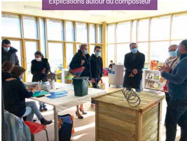
Explications autour du composteur