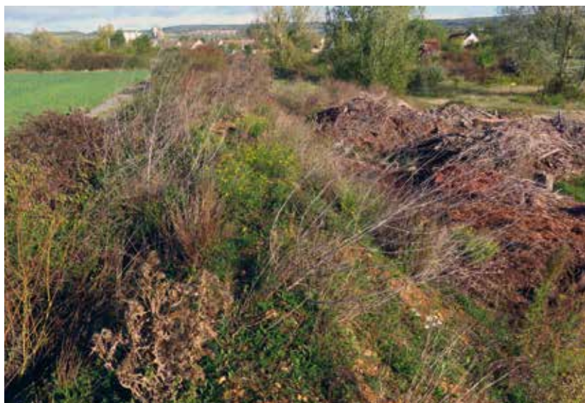
BIODIF BRUNO DREYON

Cette formule, reprise par Saint-Exupéry, illustre bien l'idée du Développement Durable : un développement de la société qui répond aux besoins actuels sans compromettre ceux des générations futures. Une problématique transversale qui considère simultanément les dimensions économique, environnementale et sociale. À Épône, nous œuvrons pas à pas pour trouver cet équilibre et permettre à chacun d'adopter les bons gestes.