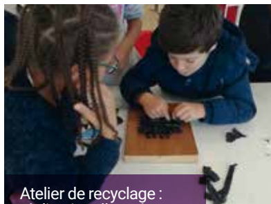
Atelier de recyclage : réalisation d'une éponge avec des chaussettes